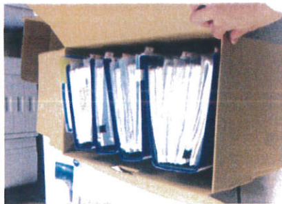
(1箱あたりの参考画像)